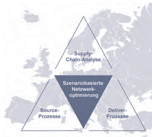
Bild 1 Themenbereiche des Supply Chain Design

Das FIR berät und unterstützt Industrieunternehmen bei der Beantwortung der oben aufgeführten oder ähnlichen Fragestellungen. Dazu wurden Methoden und Vorgehensweisen entwickelt, die sich bereits vielfach in der Praxis bewährt haben. Die Methoden sind gemäß Bild 1 in die verschiedenen Themenbereiche Supply-