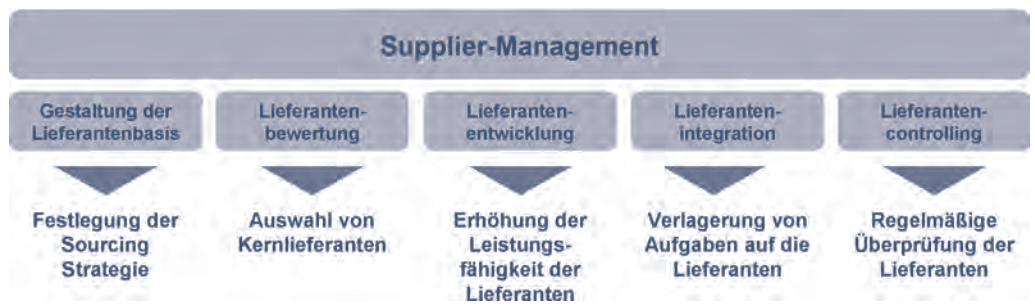
Bild 3 Ganzheitlicher Ansatz des Supplier-Managements

ungenutzt. Das FIR bietet daher Methoden zur Einführung und Verbesserung des Supplier-Managements an. In einem ganzheitlichen Ansatz können mit Hilfe der Methoden des Supplier-Managements die gesamten Einkaufsprozesse im Unternehmen verbessert werden (Bild 3). Dies beinhaltet die Definition einer Sourcingstrategie, die qualifizierte Auswahl und objektive Bewertung von Lieferanten sowie das Controlling der Lieferanten und deren Entwicklung hin zu einer verbesserten Lieferqualität oder der Übernahme von zusätzlichen Aufgaben.