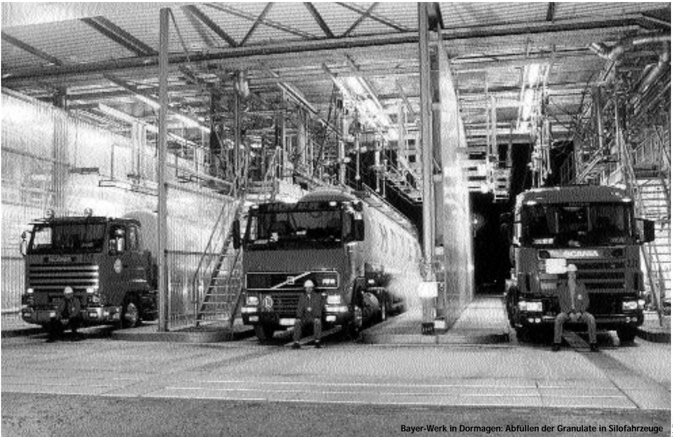
Bayer-Werk in Dormagen: Abfüllen der Granulate in Silofahrzeuge